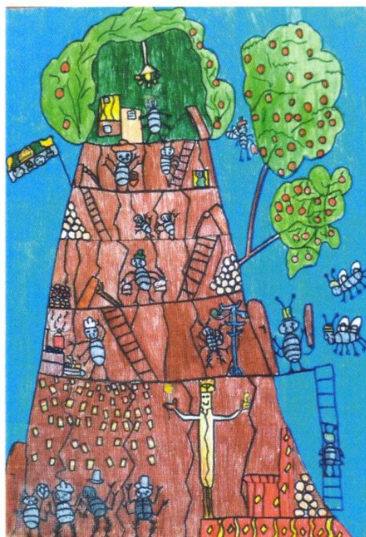
„MI VAN BELÜL?”